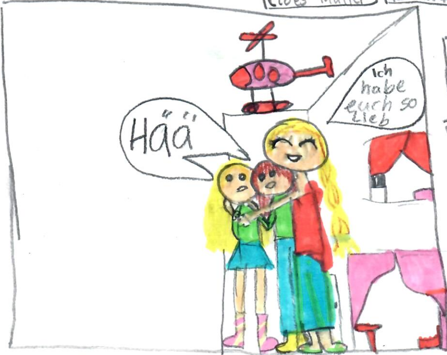
18 Cloes Mutter kommt von der Treppe runter